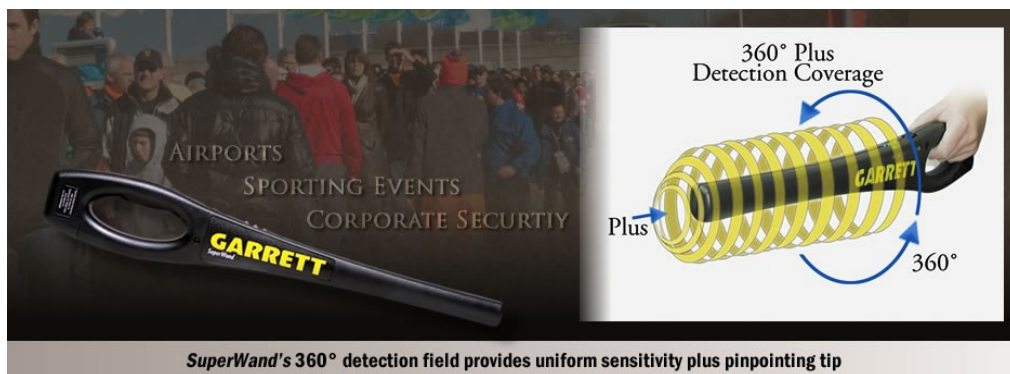
SuperWand's 360° detection field provides uniform sensitivity plus pinpointing tip