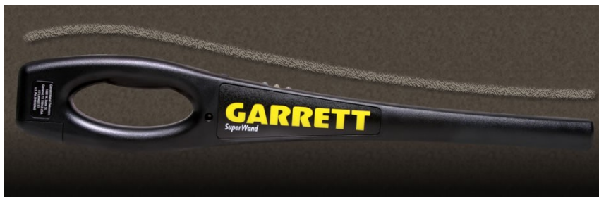
SuperWand combines sleek ergonomically design with performance.